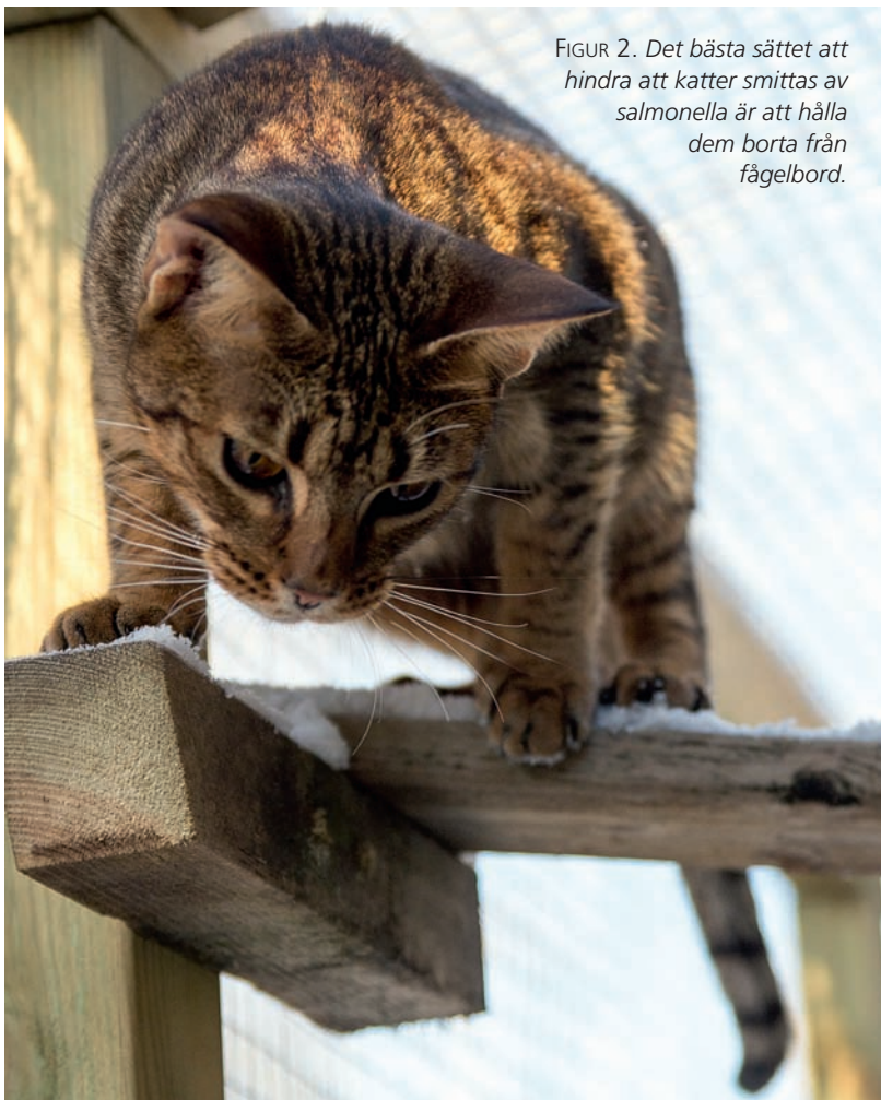
FIGUR 2. Det bästa sättet att hindra att katter smittas av salmonella är att hålla dem borta från fågelbord.