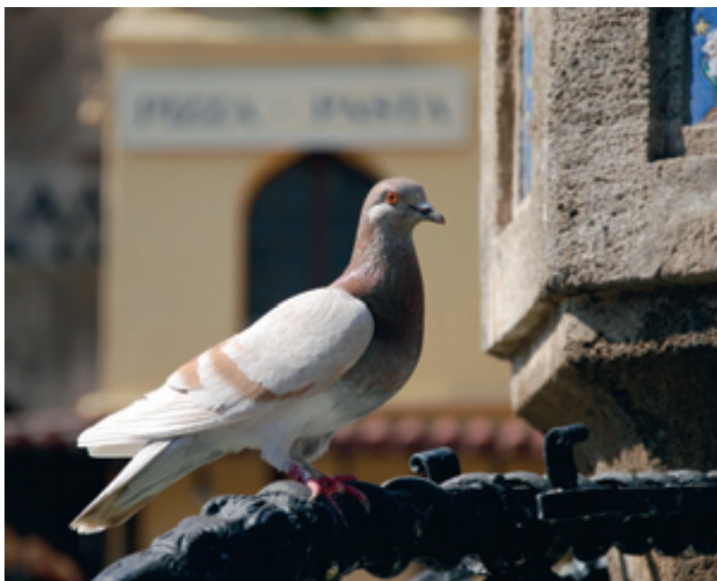
Nya riskområden i Mellansverige för newcastlesjuka har upprättats på grund av nya fynd av PPMV-1 hos vilda duvor.

I slutet av februari väcktes misstanke om rabies hos två katter. Fallen hade inget samband med varandra. Den ena katten var en nio år gammal svenskfödd utekatt som visade symptom sedan