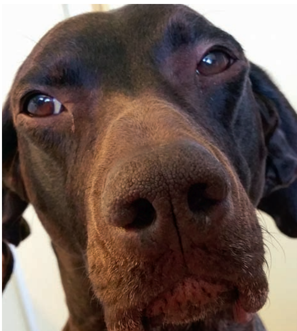
FIGUR 3. En normal vorsteh med medfött öppna nosborrar.